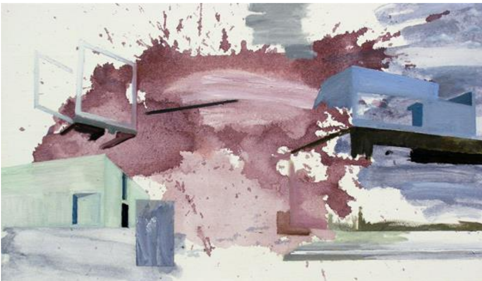
Fragmente 03 , 2019, Acryl, Öl auf Leinwand, 35 x 60 cm