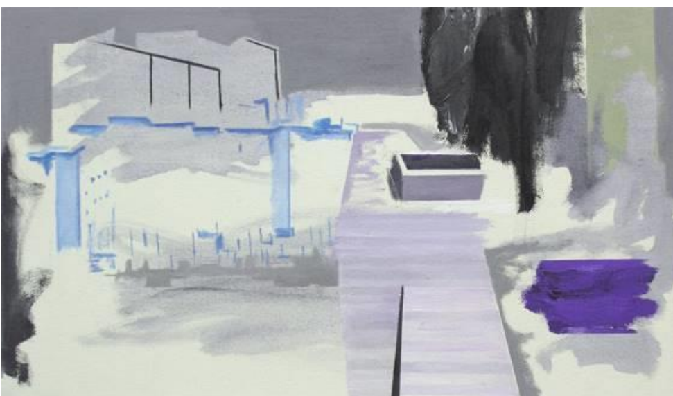
Risse 02 , 2020, Acryl, Öl auf Leinwand, 35 x 60 cm