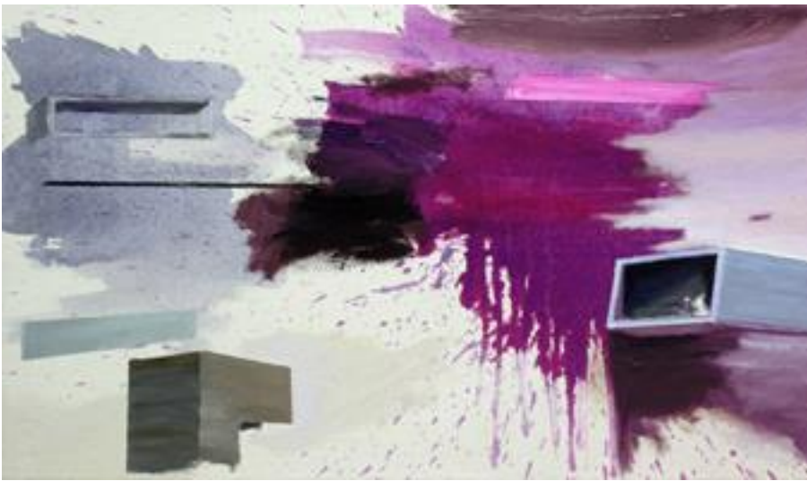
Violetter Klang , 2019/2020, Acryl, Öl auf Leinwand, 35 x 60 cm