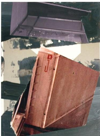
Box , Collage und Malerei, 2019 je 15 x 10,5 cm