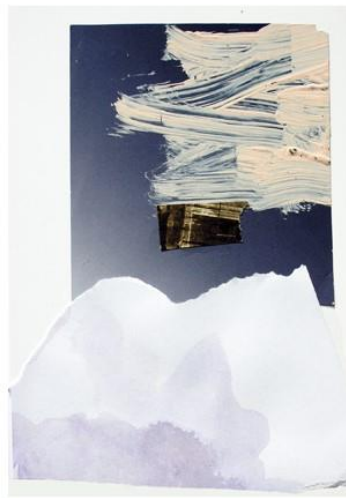
Flieder , Collage und Malerei, 2020