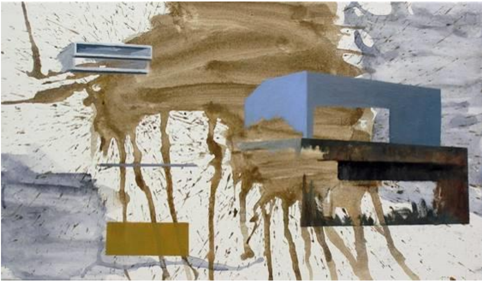
Fragmente_01 , 2019, Acryl, Öl auf Leinwand, 35 x 60 cm