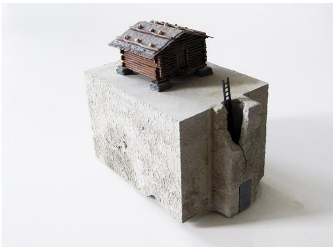
Pontormo_C_02 , Zement, Kunststoff, 15 x 9 x 13,5 cm