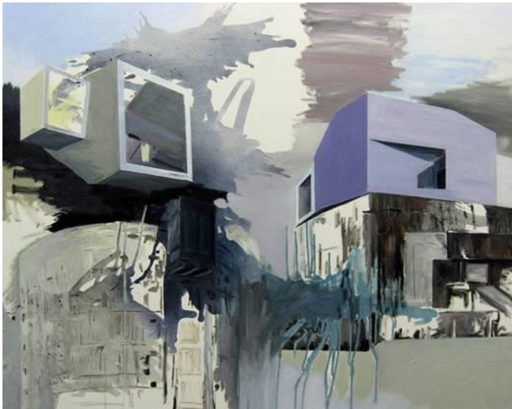
Violett , 2018/2019, Acryl, Öl auf Leinwand, 120 x 150 cm