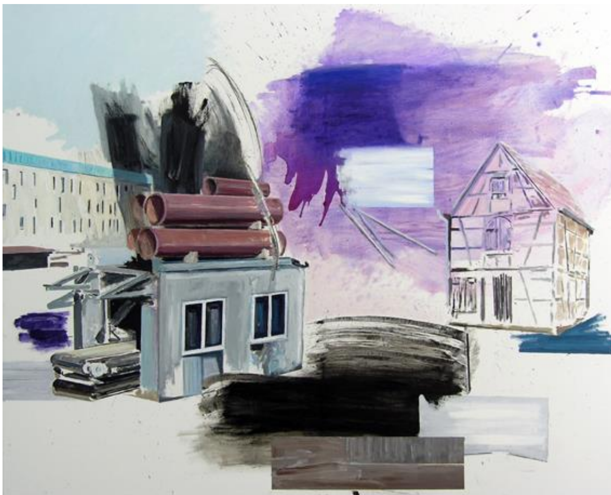
Tendenzen , 2020, Acryl und Öl auf Leinen, 150 x 120 cm