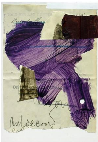
Dis , Collage und Malerei, 2020 je 15 x 10,5 cm