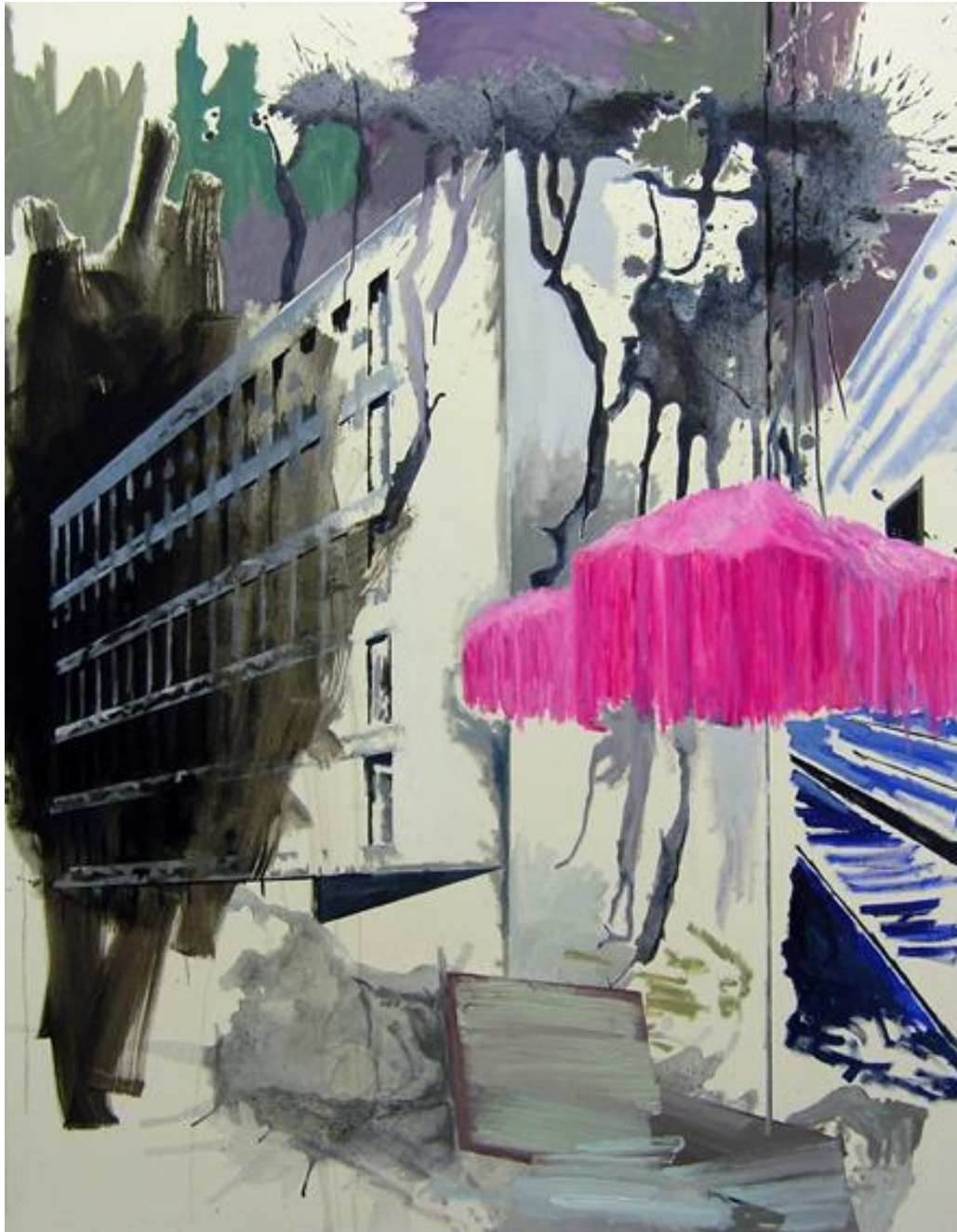
Stimmung , 2020, Acryl und Öl auf Leinen, 120 x 150 cm

*1956 in Bonn, lebt und arbeitet in Berlin