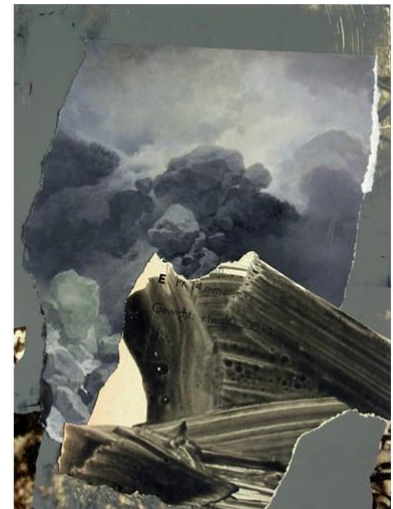
Sturmfest_03 , Collage und Malerei, 2019