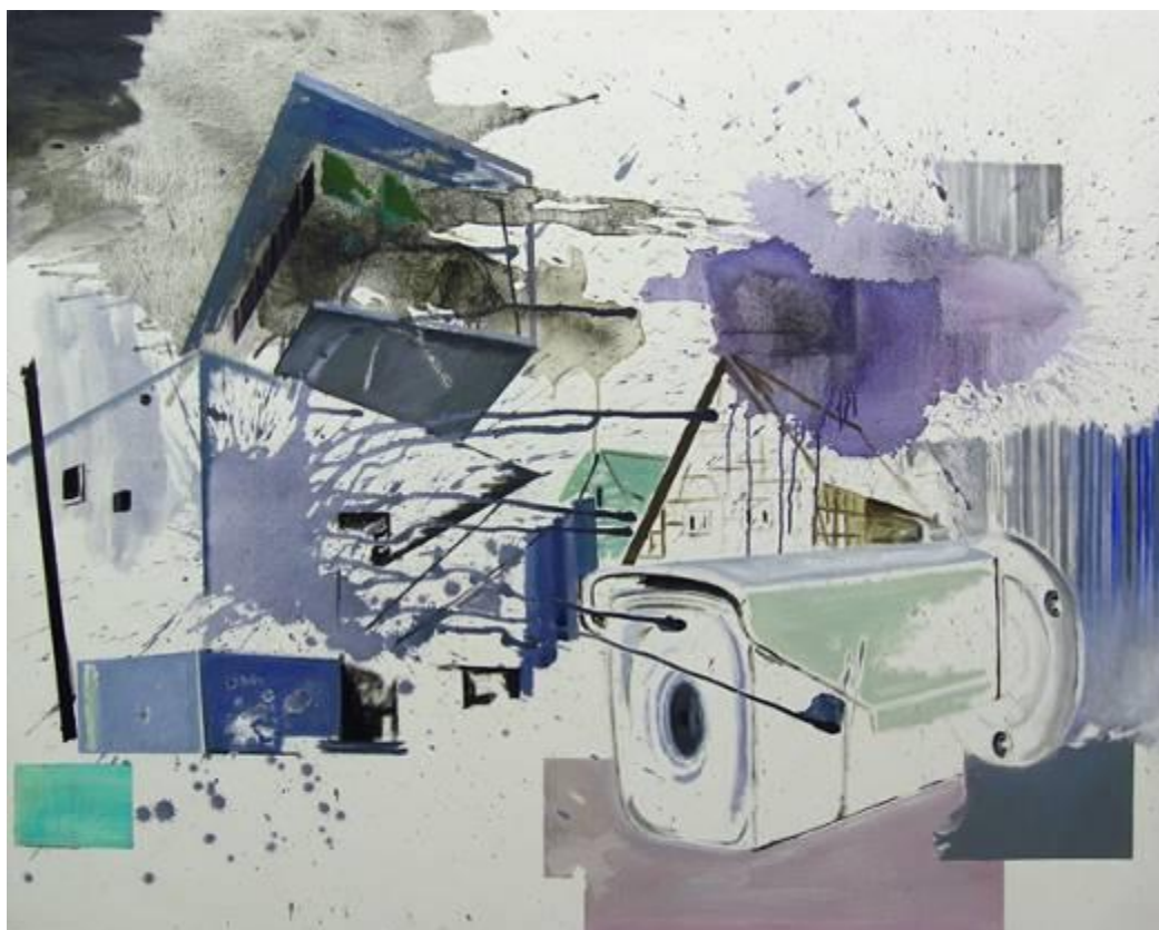
Mikado , 2019, Acryl, Öl auf Leinwand, 120 x 150 cm