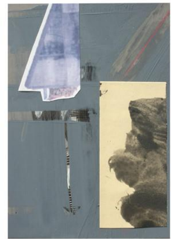
T , Collage und Malerei, 2019